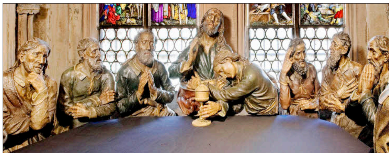
19. Jahrhundert: Apostelgruppe von F. X. Hauser (1804/06) in der Abendmahlkapelle