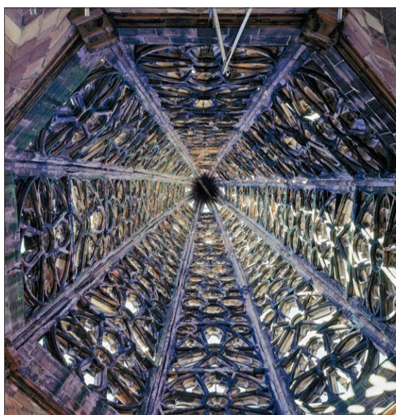
Gotik: Blick in den Turmhelm

Und manchmal liegt eben auch Brisanz in der Luft. Wenn sich etwa das 19. Jahr-