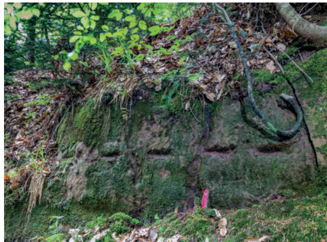
Abb. A5: Abbauwand im wohl ältesten Klostersteinbruch, nur noch erkennbar an den Mulden, die durch das Ansetzen starker Eisenkeile entstanden sind. Der Wanderweg führt direkt dran vorbei.

Etwa 100 m weiter öffnet sich das Waldgelände und man blickt von oben in den zweiten, diesmal auffallend großen Klostersteinbruch, dessen Wände jedoch auch