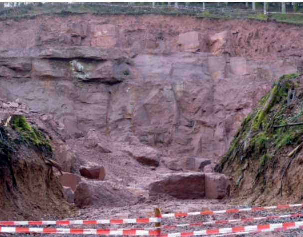
Abb. A11: Wand des Steinbruchs Langauweg der Firma Lauster Steinbau (Stuttgart). Wie in den meisten Naturwerksteinbrüchen des Landes finden Abbauarbeiten in der Regel nur einige Monate pro Jahr statt.

Wieder zurück auf der Forststraße gehen wir retour zur kleinen Holzbrücke, über die wir vorher gekommen sind (Pkt. 8 in Abb. A4). Über den Wiesengrund (Abb. A10) gehen wir entlang des Baches nach Osten. Nach rund 100 m erreichen wir rechts eine Betonbrücke, die wir in südliche Richtung überqueren. Ein leicht ansteigender Weg mündet auf die breite Forststraße »Langauweg«, dem wir links, also nach Osten folgen.