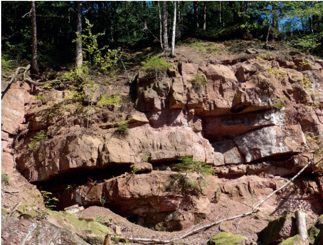
Abb. A7: Großer Münstersteinbruch (Steinbruch Nr. 3) von Westen her gesehen (Foto vom Oktober 2021). Die Exkursionsroute führt knapp oberhalb der östlichen Steinbruchkante vorbei.

Wir durchwandern den imposanten Fesenloch-Steinbruch bis zum nächsten Taleinschnitt. Dort muss die breite Forststraße nach links (d.h. in westliche Richtung) verlassen werden, wozu man einem talaufwärts steil ansteigenden, auf dem ersten Abschnitt etwas verwachsenen Waldweg folgen muss. Nach rund 400 m führt der Weg bei 360 m NN auf einer alten, lang gezogenen Steinbrucheinfahrt weiter, die von großen Abraumhalden gesäumt wird. Rund 100 m weiter verlässt man linker Hand den Weg und erreicht auf einem hohlwegartig eingetieften Pfad durch überwachsenes Gelände die Wände des alten Steinbruchs (Pkt. 4 in Abb. A4). Typisch für die dort ganz in der Nordwestecke noch anstehenden Sandsteine des sog. Platten-sandsteins ist die geringe Dicke der einzelnen Bänke. Die erhaltene Wand ist ca. 6 m hoch; an der Westwand findet man noch einen bogenförmig mit Spitzseisen bearbeiteten Abbauschchnitt, vermutlich aus dem 18./19. Jahrhundert. Große Haldenberge und mehrere Arbeitsplattformen belegen den Umfang der Arbeiten in diesem wenig bekannten Steinbruch. Man