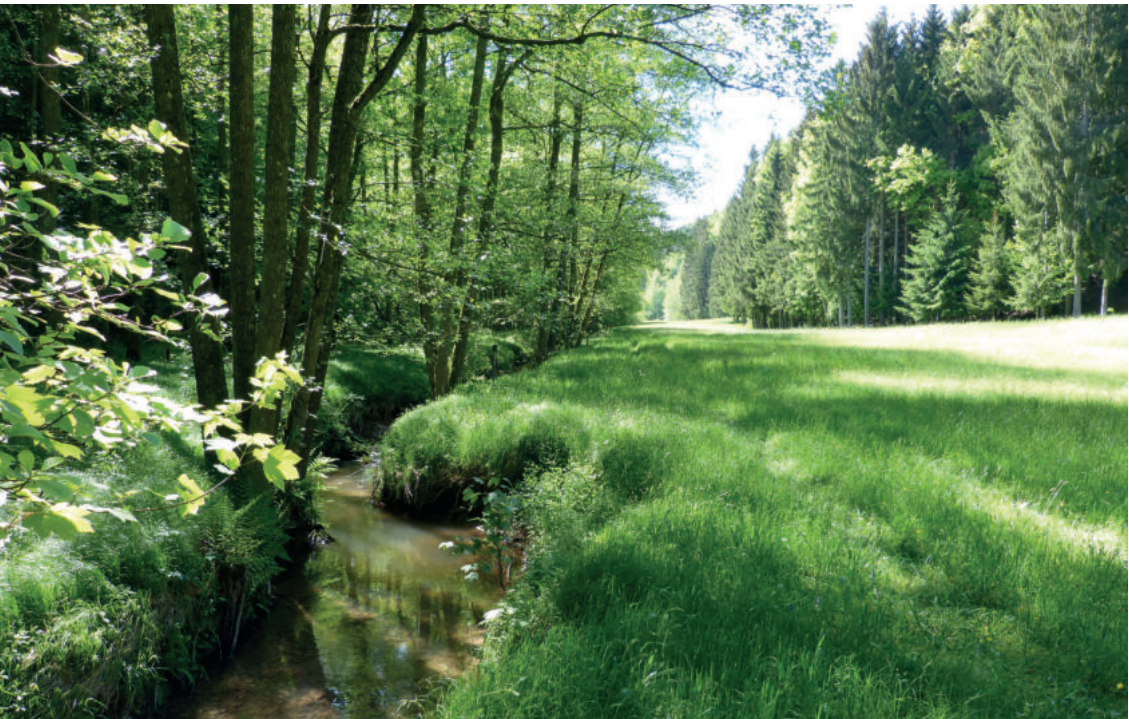
Abb. A10: Die Lange Au westlich vom ehemaligen Kloster Tennenbach.