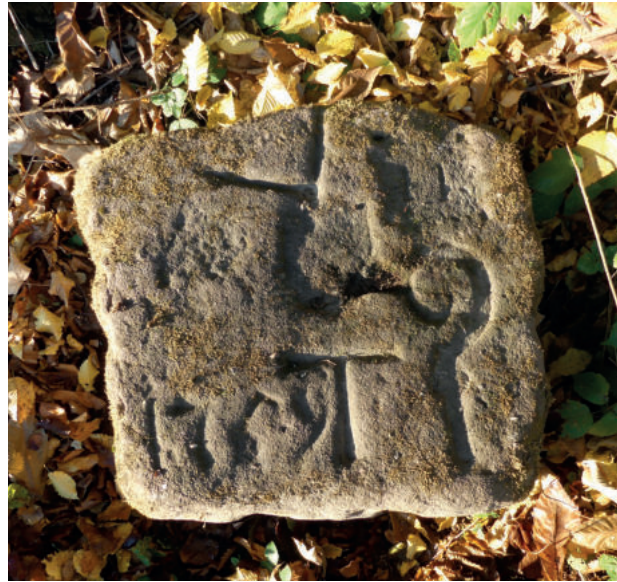
Abb. A12: Grenzstein des Klosters Tennenbach, direkt am Aubächle unterhalb der Klosterbrüche, nur rund 100 m vom Wanderparkplatz aus entfernt (Pkt. 12 der Route). Erkennbar sind die Jahreszahl »1769«, »T« für Tennenbach, der Abtsstab und der Grenzverlauf (oben: Ecke). Vielleicht stand hier die 1336 erwähnte »Steinwinde«, d.h. der Steinkran (siehe Kapitel 4.3, S. 98). Interessant ist auch, dass hierfür gelbgrauer Sandstein verwendet wurde.

Zum Abschluss empfiehlt sich ein kleiner Abstecher in westliche Richtung an das Aubächle (Pkt. 12 in Abb. A4): Knapp 100 m hinter dem Parkplatz und ca. 8 m hinter der Forstschranke, befindet sich direkt am Bach ein ungewöhnlicher Grenzstein des Klosters (Abb. A12). Er zeigt sowohl an Haupt und Seite den Abtsstab des Klosters Tennenbach. An der Kopfseite sind die Jahreszahl 1769 und der Grenzverlauf zu erkennen. Wohl wegen Hochwassergefahren handelt es sich nicht um einen senkrecht stehenden Stein der üblichen Art, sondern um einen massiven rechteckigen, tief in den Boden eingelassenen Quader von sicher mehr als 200 kg Gewicht. Die Replik dieses Steins ist seit 2021 beim Gasthof Engel aufgestellt (Pkt.11 in Abb. A4).