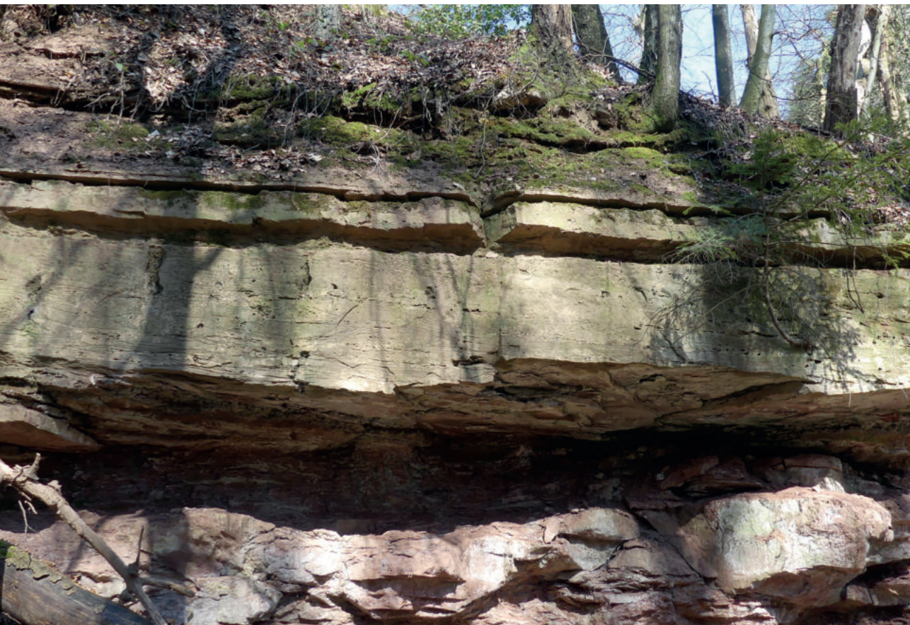
Abb. A9: Alte Steinbruchwand im großen Allmendsberger Steinbruch.

Auf dem geradlinig nach Westen führenden Talweg erreicht man nach 500 m den besonders interessanten Steinbruch am Amsenbuck (siehe Abb. 55 und 111, Pkt. 9 in Abb. A4). Der Zugang zum Steinbruch liegt etwa 5 m über der Talstraße. Auf Höhe eines Baumstumpfes links vom Weg, führt scharf rechts ein kleiner Pfad nach oben. Haldenberge am Hang weisen dem aufmerksamen Beobachter den Weg. Der kleine Aufstieg über den historischen Abfuhrweg lohnt sich! Dieser Bruch wurde im Mittelalter auf Klostergrund angelegt, um besonders große Sandsteinblöcke für Brunnen, Tür- und Fenstergewände, Maßwerke, Altäre, Säulen usw. gewinnen zu können. Beeindruckend sind die händischen Abbauspuren aus dem späten 18. Jahrhundert (siehe Abb. 45). Um 1770 wurde der Steinbruch stillgelegt, wie eine in die oberste Bank eingemeißelte Inschrift verrät, welche wegen des Moos- und Farnbewuchses bisweilen nur schwer zu erkennen ist (siehe Abb. 60).