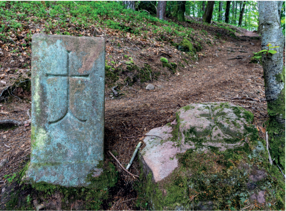
Abb. A6: Direkt oberhalb des Steinbruchs 3 (= Münstersteinbruch) befinden sich zwei Grenzsteine (rechts: der ältere liegend) mit dem Spaltkreuz der Münsterbauhütte. An diesen führt der Pfad weiter bergauf.

überschüttet sind; Haldenberge sind aber deutlich erkennbar. Nach leichtem, kurzem Anstieg sind wir nach insgesamt 500 m Wegstrecke am großen Münstersteinbruch, der hangseitig von Grenzsteinen umgeben ist, welche das charakteristische Spaltkreuz der Münsterbauhütte aufweisen (Abb. A6 und Abb. 107, Pkt. 2 in Abb. A4). Der Pfad führt knapp an der oberen Steinbruchkante vorbei. Man lässt diesen dritten Steinbruch (Abb. A7) links liegen und erreicht nach sehr kurzem Anstieg die Forststraße, der wir nach rechts (Norden) hin folgen (Achtung: Nicht auf dem gekennzeichneten Wanderpfad weitergehen, an dem weitere alte Grenzsteine stehen!).