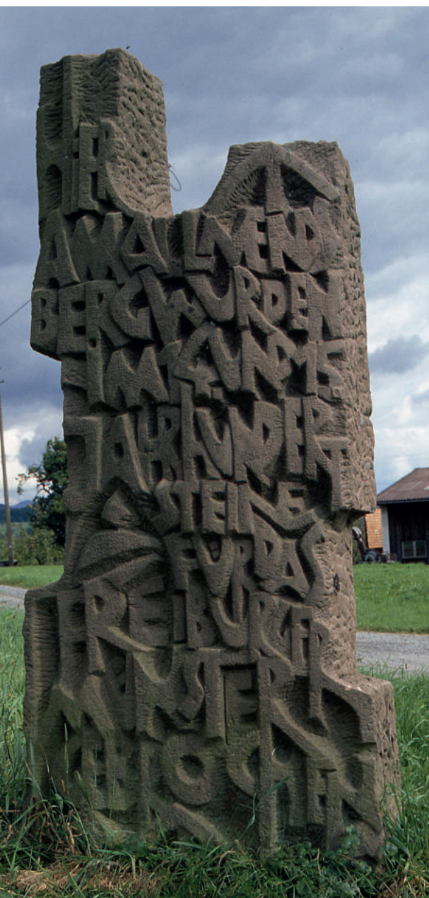
Abb. A8: Denkmal für die Allmendsberger Münstersteinbrüche direkt an der Hauptstraße im Freiamter Ortsteil Allmendsberg mit der Inschrift: »Hier am Allmendsberg wurden im 14. und 15. Jahrhundert Steine für das Freiburger Münster gebrochen«. Die Skulptur wurde 1972 von Friedrich Zimmermann aus Tailfingen geschaffen.

geht den kurzen Hohlweg zurück und setzt die Wanderung auf dem breiten Weg nach links fort. Einige Hundert Meter weiter erreicht man das freie Wiesengelände unterhalb der Häuser von Allmendsberg. Ein leicht ansteigender Weg führt vom Waldrand aus in westliche Richtung zu den beiden an der Höhenstraße gelegenen Höfen.